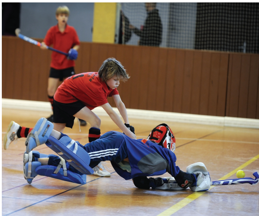
Knaben C: ESV Dresden – TSV Blau-Weiß Torgau 4:1 (1:1) am 12. März 2011